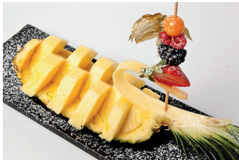
Ananas al Naturale