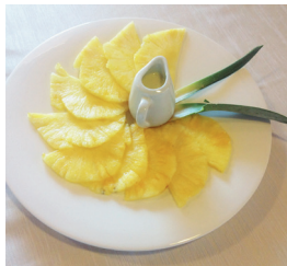
Carpaccio di Ananas con Crema Inglese alla Vaniglia