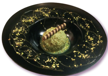
Tartufo al Pistacchio