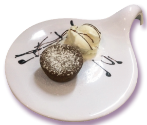
Tortino caldo al Cioccolato con gelato

TORTINO CALDO AL CIOCCOLATO 6,00 (con gelato al fior di latte)