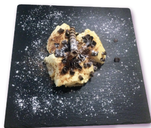
Vellutata di Mascarpone con scaglie di cioccolato fondente