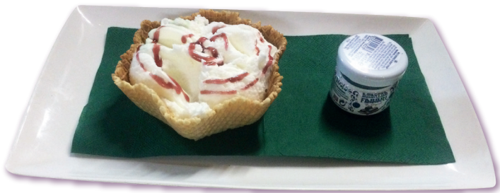
Gelato fior di latte con vasetto di amarene Fabbri

(Correzione Wodka - Liquori - Irish Coffè - Caffè Borghetti + € 2,00)