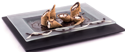
Semifreddo con Crema di Mascarpone