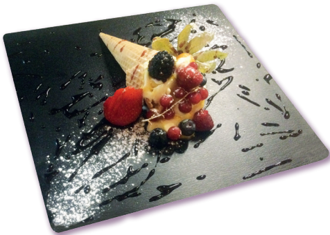
Cono cialda alla maracuja

CAFÈ "GOURMAND" 12,00 (4 selezione della casa + bicchierino passito + caffè)